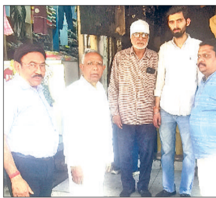
सिरसा। पीड़ित दुकानदार से मिलते व्यापारी नेता।