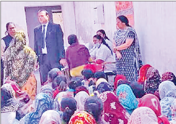
सिरसा। जिले जेल में बंदियों को जागरूक करते।

जिला विधिक सेवा प्राधिकरण द्वारा मार्च और अप्रैल माह में स्कीम न्याय और सम्मान के अंतर्गत महिला एवं वृद्ध बंदियों के लिए जागरूकता कार्यक्रम और प्रचार अभियान चलाया जा रहा है। इस अभियान का उद्देश्य जेल में बंद महिलाओं और वरिष्ठ नागरिकों को उनके अधिकारों के प्रति जागरूक करना तथा उन्हें