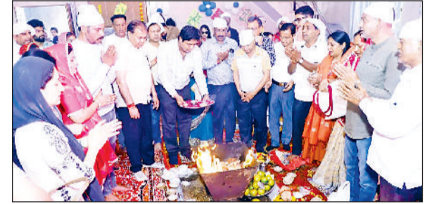
फतेहाबाद। शनिदेव मंदिर में हवन करते मंडल सदस्य।

सिरसा। प्रदेश युवा कांग्रेस के वरिष्ठ उपाध्यक्ष मोहित शर्मा ने कहा कि मौजूदा समय में भ्रष्टाचार चरम पर पहुंच चुका है और प्रशासनिक व्यवस्थाओं में अव्यवस्था का बोलबाला है। महंगाई, बेरोजगारी और बढ़ते अपराधों के कारण आम जनता का जीवन कठिन हो गया है। मोहित ने जारी बयान में कहा कि भाजपा सरकार जनता से किए गए वादों को पूरा करने में पूरी तरह असफल रही है। भाजपा के कार्यकाल में लगातार महंगाई बढ़ती जा रही है, जिससे आम आदमी की जेब पर भारी बोझ पड़ रहा है। रोजमर्रा की जरूरत की वस्तुओं के दाम बढ़ने से मध्यम वर्ग और गरीब वर्ग सबसे अधिक प्रभावित हो रहा है।