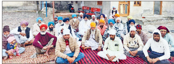
सिरसा। बैठक करते किसान।

को सोलर वॉटर पंपिंग सिस्टम लगाने का वर्क आर्डर जारी हुआ है, बाकी 19923 किसानों की लगभग 170 करोड़ जमा राशि तीन महीनों से सरकार के पास पड़ी है, जिसका किसानों को वापसी भुगतान नहीं किया जा रहा है। किसानों को सोलर कनेक्शन की नहीं मिला और वह अपनी जमा राशि वापस लेने के लिए बार-बार विभाग के चक्कर काट रहे हैं। उन्होंने अतिरिक्त