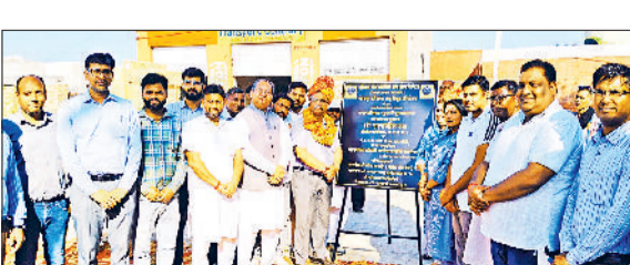
भूना। डिजिटल लाइब्रेरी का शिलान्यास करते हुए परमाणु संयंत्र के निदेशक।