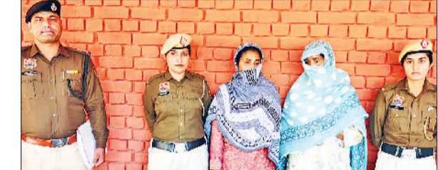
सिरसा। दोहरे हत्याकांड में संलिप्त आरोपी महिलाएं।

और एकजुट होकर प्रशासन के खिलाफ अपना रोष प्रकट किया। डॉक्टरों ने एक स्वर में कहा कि ऑन-ड्यूटी डॉक्टर के साथ पुलिस द्वारा की गई इस तरह की घटना न केवल निन्दनीय है बल्कि पूरी मेडिकल बिरादरी के सम्मान पर सीधा हमला है। केवल एसएचओ को सस्पेंड कर देना पर्याप्त नहीं है। एसोसिएशन की स्पष्ट मांग है कि संबंधित एसएचओ और उसके साथ शामिल चार अन्य पुलिस कर्मियों के खिलाफ संबंधित धाराओं में तुरंत एफ.आई.आर दर्ज की जाए।