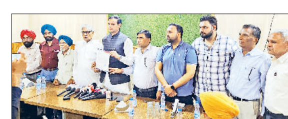
रतिया। बैठक में भाग लेते महाशक्ति चैरिटेबल ट्रस्ट के सदस्य।