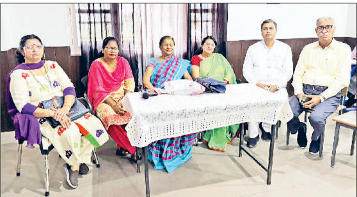
फतेहाबाद। जिला स्तरीय सम्मेलन में मौजूद अतिथिगण।

युवतियों को आत्मरक्षा के विभिन्न उपायों के बारे में विस्तार से बताया