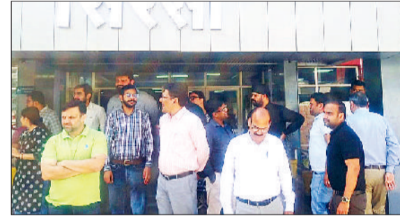
सिरसा। नागरिक अस्पताल में रोष जाहिर करते चिकित्सक।

की ओपीडी सेवा बन्द कर इसका विरोध जताया जाए। उन्होंने कहा कि इस वक्त पूरी एसोसिएशन पीडित डॉक्टर के साथ खड़ी है। बैठक में कहा गया कि आगे की रणनीति का निर्णय राज्य कार्यकर्ता की बैठक में लिया जाएगा। बैठक के दौरान सबसे अहम फैसला यह लिया गया कि विरोध के दौरान इमरजेंसी, लेबर रूम व पोस्टमार्टम की सेवाएं जारी रहेगी। बैठक के दौरान डॉक्टरों ने प्रशासन से मांग की है कि इस मामले में संबंधित एसएचओ व अन्य पुलिस कर्मियों के खिलाफ उचित कार्यवाही करते हुए जल्द से जल्द न्याय दिलाया जाए।