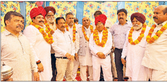
सिरसा। स्वर्णकार संघ के चुने पदाधिकारी।

स्वर्णकार संघ के जिला प्रधान पद के लिए संवैधानिक रूप से प्रक्रिया अमल में लाई जा रही है, लेकिन समाज के कुछ असामाजिक तत्वों द्वारा अपनी मर्जी से ही प्रधान का चयन कर लिया, जो कि संघ को किसी भी स्तर में स्वीकार्य नहीं है। 8 मार्च को शहर की बेगू रोड स्थित सोनी धर्मशाला में सुबह 10 बजे चुनाव प्रक्रिया पूरी की जाएगी और जो भी प्रधान चुना जाएगा, वो संघ को स्वीकार्य होगा। उक्त बातें चुनाव