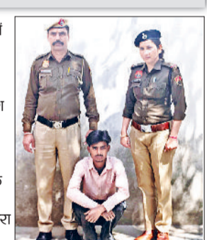
सिरसा। दानपात्र चोरी मामले में पकड़ा गया आरोपी।