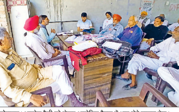
फतेहाबाद। आक्रोश रैली को लेकर आयोजित बैठक में भाग लेते माकपा नेता।