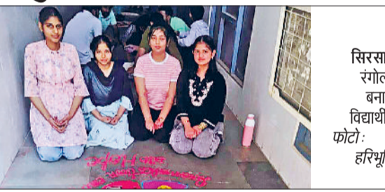
सिरसा। रंगोली बनाते विद्यार्थी।