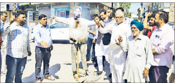
रतिया। रैपर बादशाह का पुतला फूकते महाशक्ति चैरिटेबल ट्रस्ट के सदस्य।