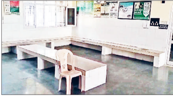
जाखल। सुनसन पड़ा जाखल सीएचसी।

जाखल के सीएचसी में शनिवार को ओपीडी सेवाएं पूरी तरह से बंद रही। इस दौरान मरीज इधर उधर भटकते नजर आए। डॉक्टरों द्वारा सेवाएं ठप करने का निर्णय करना जिले के घरोड़ा में ड्यूटी पर तैनात एक मेडिकल ऑफिसर के साथ हुई मारपीट व अवैध